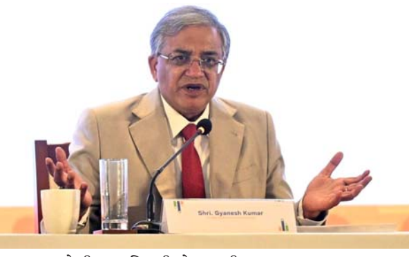
રાજ્યના પોલીસ અધિકારીઓ અને વકીલો અધિકારીઓ સાથે બેઠક યોજાશે તેમણે કહ્યું હતું કે ચૂંટણી વખતે કાયદો-વ્યવસ્થાનું યોગ્ય પાલન થવું જરૂરી છે. કાયદો-વ્યવસ્થાનો ભંગ થશે તો આકરા પગલાં ભરાશે. અરાજકતા ન સર્જાય તે માટે તેમણે અધિકારીઓને તાકીદ કરી હતી. રાજ્યની તમામ એજન્સીઓને તેમણે કાયદો-વ્યવસ્થાની સ્થિતિ સામે ઝીરો ટોલરન્સની પોલિસી અપનાવવાની ભલામણ કરી હતી.

કોલકાતા, તા. ૧૦ બંગાળમાં વિધાનસભાની ચૂંટણી પહેલાં મુખ્ય ચૂંટણી કમિશ્નર જ્ઞાનેશ કુમાર બંગાળની મુલાકાતે પહોંચ્યા હતા. તેમણે અધિકારીઓ સાથે બેઠક કરી હતી અને તાકીદ કરી હતી કે બંગાળની ચૂંટણીમાં કાયદો-વ્યવસ્થાની સ્થિતિ જે કોઈ જોખમમાં મૂકશે તેની સામે કડક કાર્યવાહી કરાશે. રાજ્યના ચૂંટણી પંચના અધિકારીઓ સાથે બેઠક કરીને મુખ્ય ચૂંટણી કમિશ્નરે આવનારી ચૂંટણી અંગે જાણકારી મેળવી હતી.