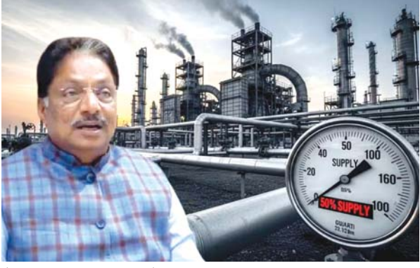
(સંપૂર્ણ સમાચાર સેવા) ગાંધીનગર, તા. ૧૦ ગુજરાતમાં ગેસના પુરવઠાની સ્થિતિને ધ્યાનમાં રાખીને રાજ્ય સરકારે મહત્વનો નિર્ણય લીધો છે. ઘરેલુ ગેસ પુરવઠો અવિરત જળવાઈ રહે તે માટે ઉદ્યોગોને આપવામાં આવતા ગેસના વપરાશમાં ૫૦ ટકા સુધીનો કાપ મુકવામાં આવ્યો છે. ઊર્જા અને પેટ્રોકેમિકલ્સ મંત્રી ઋષિકેશ પટેલે જણાવ્યું હતું કે, રાજ્ય સરકારની સર્વોચ્ચ પ્રાથમિકતા એ છે કે રાજ્યના એકપણ ઘરમાં ગેસના અભાવે ચૂલો બંધ ન રહે. તેથી ગેસના પુરવઠા અને વધતી માંગ વચ્ચે સંતુલન જાળવવા માટે ઉદ્યોગોને કાપ મુકવાનો નિર્ણય લેવાયો છે. સરકારે સ્પષ્ટતા કરી છે કે આ કાપ મુખ્યત્વે મોટા