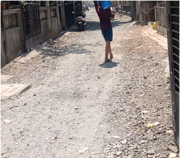
(વર્તમાન પ્રવાહ ન્યુઝ નેટવર્ક) વલસાડ, તા. ૧૦ વલસાડ શહેરમાંથી પસાર થતો સ્ટેટ હાઈવે જે શહેરનો સૌથી વ્યસ્ત માર્ગ છે ૨૪ કલાક ધમધમતો રહે છે આ રસ્તાનો સિમેન્ટ કોક્રિટ રોડ બનાવવાનું કામ છેલ્લા આઠ મહિનાથી ચાલી રહ્યું છે આ કામ કાચબા ગતિએ ચલાવતા હજારો વાહન ચાલકોને બારે હાલાકીનો સામનો કરવો પડી રહ્યો છે. સીસી માર્ગની કામ કરતી એજન્સી બાંધકામ વિભાગ

રીતસરની લોકોને હેરાન કરવાની ઢેકે લીધો હોય તેવું લાગી રહ્યું છે. લોકોને આગોતરી જાણ કરવા કે કોઈ વૈકલ્પિક ટ્રાફિક વ્યવસ્થા કર્યા વગર ગમે ત્યાં ગમે તે રસ્તા બંધ કરી દે છે. હાલમાં કેરી માર્કેટ આગળ કામ ચાલી રહ્યો હોવાથી એક માર્ગ બંધ કરી દેવામાં આવ્યો છે એકાદ માસમાં કેરીનો માર્કેટ શરૂ થવાનું હોય રસ્તા કામના ઢેકાણા ના હોય કેરીના વેપારીયા ઊંચા નીચા થયા છે. એજ રીતે વલસાડ નગરપાલિકા પણ શહેરીજનોનું