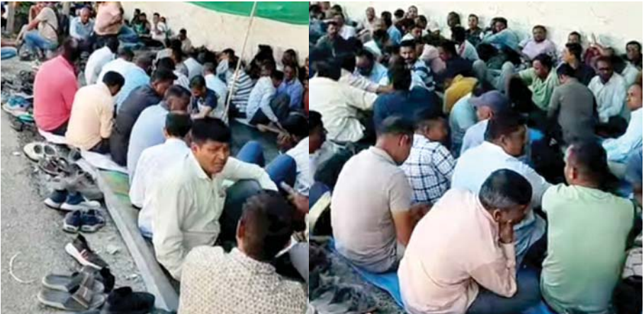
(વર્તમાન પ્રવાહ વાપી બ્યુરો) વાપી, તા. ૧૦ વાપી બલીઠા સ્થિત આલોક કંપનીના ૫૦૦ ઉપરાંત કામદારો છેલ્લા ૧૫ દિવસથી કંપનીને ગેટ

પાસે હડતાલ ઉપર બેસી ગયા છે. કામદારો નવા કાયદા મુજબ પગાર વધારવાની લડત ચલાવી રહ્યા છે. સરકાર દ્વારા કામદારોના વેતન અંગે નવો કાયદો લાવવામાં આવ્યો છે. પરંતુ હકીકત એ છે કે આલોક કંપનીના કામદારોને નવા પગારનો લાભ મળ્યો નથી. તેથી કામદારો હડતાલ ઉપર ઉતરી