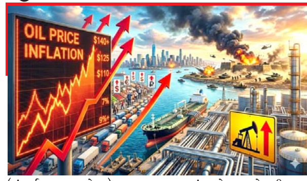
(સંપૂર્ણ સમાચાર સેવા)

નવી દિલ્હી, તા. ૧૦ અમેરિકા-ઈઝરાયલ ઈરાન સાથે છેલ્લા ૧૧ દિવસથી યુદ્ધ કરી રહ્યા છે, તો ઈરાનને વિશ્વભર માટે સૌથી મહત્વનો જળમાર્ગ હોર્મુઝ બંધ કરવાના કારણે અનેક તેલ ટેકરો સહિતનો સામાન અટકી પડ્યો છે, યુદ્ધના કારણે સંયુક્ત આરબ અમીરાત અને સાઉદી અરેબિયા સહિતના દેશોએ પણ આયાત પર કામ મુકી દીધું છે, જેના કારણે અનેક દેશોમાં ફ્યુલ સંકટને લઈ હાહાકાર મચી ગયો છે. મધ્ય-પૂર્વમાં ભયાનક યુદ્ધ ચાલી રહ્યું હોવાના કારણે ભારત સહિત વિશ્વના અનેક દેશો