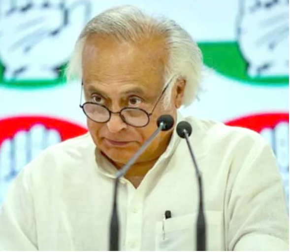
(સંપૂર્ણ સમાચાર સેવા) રાજ્યોના ગઈકાલે જાહેર થયા નવી દિલ્હી, તા. ૩૦ એકિઝિટ પોલ જાહેર થયા બાદ પશ્ચિમ બંગાળ સહિત પાંચ કોંગ્રેસનું નિવેદન સામે આવ્યું

જયરામ રમેશે ગંભીર આક્ષેપ કરતા કહ્યું કે, 'ચૂંટણી પંચે આ ચૂંટણીઓમાં નિષ્પક્ષ કામગીરી નિભાવી નથી