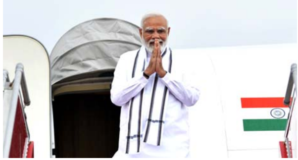
(સંપૂર્ણ સમાચાર સેવા)

વડોદરામાં નેશનલ હાઈવે પાસે નિર્માણ પામેલા ભવ્ય સરદારધામનું પીએમના હસ્તે લોકાર્પણ થવાની શક્યતા