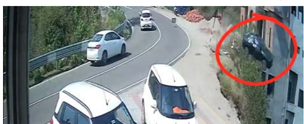
(સંપૂર્ણ સમાચાર સેવા)

શીમલા, તા.૩૦ હિમાચલ પ્રદેશના ચિતપૂર્ણા વિસ્તારમાં એક ભયંકર માર્ગ અકસ્માતમાં પંજાબના બે શ્રદ્ધાળુઓના કરુણ મોત થયા છે. આ અકસ્માત ઉના જિલ્લાના ભરવાઈ વિસ્તારમાં તે સમયે થયો જ્યારે એક કાર આશરે ૨૦૦ ફૂટ ઊંડી ખીણમાં ખાબકી અને તેમાં આગ લાગી ગઈ. ઘટનાનો એક વીડિયો સામે આવ્યો છે, જે કોઈ બોલીવુડ ફિલ્મમાં સ્ટેટ સીન જેવો લાગી રહ્યો છે. એક પૂરઝડપે આવતી કાર પહાડી રસ્તા પર સીધી ઊંડી ખીણમાં જઈ પડી. આ દરમિયાન કારની ઝડપ જરા પણ ઓછી થતી દેખીણ ન હતી. એવું લાગી રહ્યું છે કે જાણે ડ્રાઈવર કોઈ ફિલ્મનો ખતરનાક સ્ટેટ કરી રહ્યો હોય. અકસ્માતના સીસીટીવીમાં