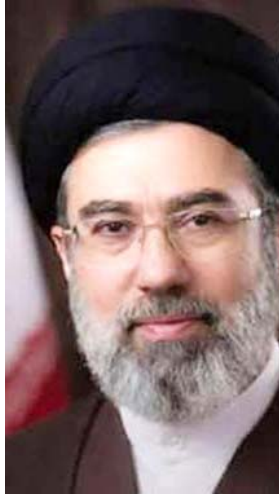
ઈરાનના નેવી કમાન્ડર શાહરામ ઈરાનીએ અમેરિકા અને ઈઝરાયલ સામે ઈરાનનું નવું હથિયાર શું હશે તે અંગે માહિતી નથી આપી.

ઈરાનની નૌકાદળે અમેરિકા અને ઈઝરાયલને એક નવા હથિયારથી ધમકી આપી છે. આ સાથે જ મજાક ઉડાવતા કહ્યું કે, અમારા નવા હથિયારથી દુશ્મનોને હાર્ટએટેક આવી જશે. આ નિવેદન એવા સમયે આવ્યું છે જ્યારે ટૂંકે ટૂંકે ફરીથી ખોલવાના ઈરાનના પ્રસ્તાવને ફગાવી દીધો છે. એક અહેવાલ પ્રમાણે ઈરાનના નેવી કમાન્ડર રિયર એડમિરલ શાહરામ ઈરાનીએ કહ્યું કે, ઈસ્લામિક ગણતંત્ર ટૂંક સમયમાં દુશ્મનોને નવા હથિયારથી જવાબ આપશે. આ હથિયાર અંગે વાત કરતા તેમણે કહ્યું કે, દુશ્મનો આનાથી ખૂબ જ ડરે છે. આ હથિયાર તેમના ખૂબ જ નજીક છે અને મને આશા છે કે તેમને હાર્ટએટેક નહીં આવે. કમાન્ડરે કહ્યું કે, દુશ્મનોએ ખોટું વિચાર્યું હતું કે ઈરાન સામે તેમની નવી ઉશ્કેરણીવાળી કાર્યવાહીથી ખૂબ જ ટૂંકા સમયમાં તેમના ઈશ્ચિત પરિણામો પ્રાપ્ત કરી લેશે. તેમની આ જ વિચારસરણી હવે લશ્કરી એકેડેમીમાં મજાક બની ગઈ છે. જોકે તેમણે અમેરિકા અને ઈઝરાયલ સામે ઈરાનનું નવું હથિયાર શું હશે તે અંગે માહિતી નથી આપી. નૌસેના કમાન્ડરના જણાવ્યા પ્રમાણે ૨૮ ફેબ્રુઆરીથી સંઘર્ષ તેજ થયા બાદ ઈરાની સશસ્ત્ર દળોએ અમેરિકા અને ઈઝરાયલના ઠેકાણાઓ પર અત્યારે પણ આરોપ લગાવ્યો હતો કે, સંઘર્ષ દરમિયાન તેણે પોતાની સૈન્ય હાજરી વધારી છે, જેમાં વધારાના યુદ્ધજહાજો અને મિસાઈલ પ્લેટફોર્મ તહેનાત કરવામાં આવ્યા છે. તેમણે કહ્યું કે શરૂઆતી નેવલ એટેક નિષ્ફળ રહ્યા અને તેઓ હજુ પણ ફસાયેલા છે.