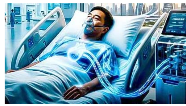
અન્ય સાધનો વડે પણ મદદ કરાઈ હતી. ૪૦ કલાક એકમોના સહારે જીવેલા દર્દીનું હૃદય ફરીથી ધબકવા તો લાગ્યું, પણ ધબકારા અનિયમિત હતા. ડોક્ટરો અને નર્સોની ૧૦ દિવસની સારવાર બાદ હૃદય ફરીથી સામાન્ય રીતે ધબકવા લાગ્યું. ડોક્ટરોએ જણાવ્યું કે તેને 'ફ્લમિનેન્ટ મ્યોકાર્ડિટિસ' (હૃદયના સ્નાયુમાં સોજો) હતો, જે એક ગંભીર બીમારી છે. એકમો મશીને તેના હૃદયને આરામ કરવાની અને સાજા થવાની તક આપી. ૨૦ દિવસમાં તે એટલો સ્વસ્થ થઈ ગયો કે જાતે જ ચાલીને ઘરે ગયો.

ઈરાનની નૌકાદળે અમેરિકા અને ઈઝરાયલને એક નવા હથિયારથી ધમકી આપી છે. આ સાથે જ મજાક ઉડાવતા કહ્યું કે, અમારા નવા હથિયારથી દુશ્મનોને હાર્ટએટેક આવી જશે. આ નિવેદન એવા સમયે આવ્યું છે જ્યારે ટૂંકે ટૂંકે ફરીથી ખોલવાના ઈરાનના પ્રસ્તાવને ફગાવી દીધો છે. એક અહેવાલ પ્રમાણે ઈરાનના નેવી કમાન્ડર રિયર એડમિરલ શાહરામ ઈરાનીએ કહ્યું કે, ઈસ્લામિક ગણતંત્ર ટૂંક સમયમાં દુશ્મનોને નવા હથિયારથી જવાબ આપશે. આ હથિયાર અંગે વાત કરતા તેમણે કહ્યું કે, દુશ્મનો આનાથી ખૂબ જ ડરે છે. આ હથિયાર તેમના ખૂબ જ નજીક છે અને મને આશા છે કે તેમને હાર્ટએટેક નહીં આવે. કમાન્ડરે કહ્યું કે, દુશ્મનોએ ખોટું વિચાર્યું હતું કે ઈરાન સામે તેમની નવી ઉશ્કેરણીવાળી કાર્યવાહીથી ખૂબ જ ટૂંકા સમયમાં તેમના ઈશ્ચિત પરિણામો પ્રાપ્ત કરી લેશે. તેમની આ જ વિચારસરણી હવે લશ્કરી એકેડેમીમાં મજાક બની ગઈ છે. જોકે તેમણે અમેરિકા અને ઈઝરાયલ સામે ઈરાનનું નવું હથિયાર શું હશે તે અંગે માહિતી નથી આપી. નૌસેના કમાન્ડરના જણાવ્યા પ્રમાણે ૨૮ ફેબ્રુઆરીથી સંઘર્ષ તેજ થયા બાદ ઈરાની સશસ્ત્ર દળોએ અમેરિકા અને ઈઝરાયલના ઠેકાણાઓ પર અત્યારે પણ આરોપ લગાવ્યો હતો કે, સંઘર્ષ દરમિયાન તેણે પોતાની સૈન્ય હાજરી વધારી છે, જેમાં વધારાના યુદ્ધજહાજો અને મિસાઈલ પ્લેટફોર્મ તહેનાત કરવામાં આવ્યા છે. તેમણે કહ્યું કે શરૂઆતી નેવલ એટેક નિષ્ફળ રહ્યા અને તેઓ હજુ પણ ફસાયેલા છે.