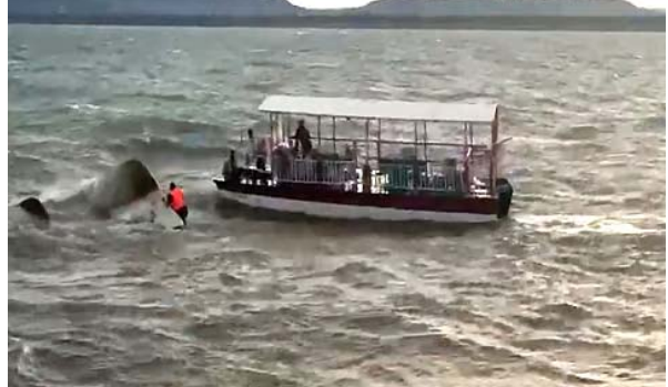
(સંપૂર્ણ સમાચાર સેવા)

જબલપુર, તા.૩૦ મધ્યપ્રદેશના જબલપુરના પ્રસિદ્ધ પર્યટન સ્થળ બરગી ડેમમાં ગુરુવારે સાંજે એક મોટી દુર્ઘટના બની છે. નર્મદા નદીના બેકવોટરમાં પ્રવાસીઓ થી ભરેલી એક ફૂલ અયાનક ડુબી જતાં વિસ્તારમાં અફરાતફરી મચી ગઈ છે. અત્યાર સુધીમાં ૧૫ લોકોને બચાવી લેવાયા છે, જ્યારે ચારના મૃતદેહ મળી