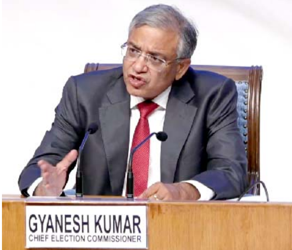
ધરાયેલા એકિઝિટ પોલ જાહેર કરવામાં આવ્યા છે. જે મુજબ આસામમાં ભાજપ, કેરળમાં કોંગ્રેસ-ડાબેરી, તમિલનાડુમાં