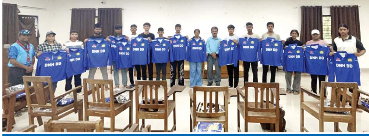
દાનહની તમામ યુવતીઓ અને ખેલાડીઓને લાયન્સ ક્લબ ઓફ સેલવાસે આપેલો સંપૂર્ણ સહયોગ

(વર્તમાન પ્રવાહ ન્યુઝ નેટવર્ક) સેલવાસ, તા.૧૦ ભારત સરકારના રમત-ગમત અને યુવા બાબતોના મંત્રાલય અંતર્ગત દાદરા નગર હવેલી અને દમણ-દીવમાં ટી-૧૦ લેધર બોલ ક્રિકેટ ખેલાડીઓની એક ટીમ બનાવવામાં આવી હતી. જેમાં યુવતીઓ અને યુવકોને સમાન તકો પૂરી પાડવામાં આવી રહી છે. તે અનુસાર 'ખેલો ઈન્ડિયા' સેન્ટરના ઓરિઝિટોરીયમમાં દાદરા નગર