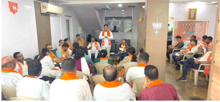
(વર્તમાન પ્રવાહ વાપી બ્યુરો) વાપી, તા.૧૬