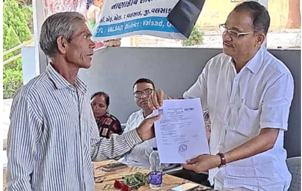
વલસાડ, તા.૧૬