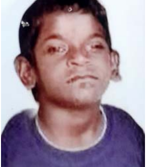
વલસાડ, તા.૧૬