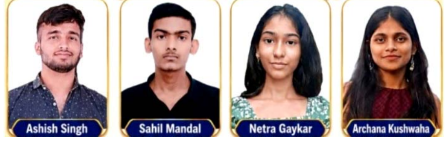
(વર્તમાન પ્રવાહ વાપી બ્યુરો) વાપી, તા.૧૬

વાપીના ચણદે કોલોની સ્થિત કેશવજી ભારમલ સુમરીયા એન્ડ નટરાજ પ્રોફેશનલ સાયન્સીસ કોલેજમાં બી.કેમ., બી.એસસી., બી.સી.એ., બી.બી.એ., એમ.કેમ. અને એમ.એસસી. સહિતના વિવિધ અભ્યાસક્રમો સફળતાપૂર્વક ચલાવવામાં આવે છે. વીર નરેન્દ્ર દક્ષિણ ગુજરાત યુનિવર્સિટી, સુરત