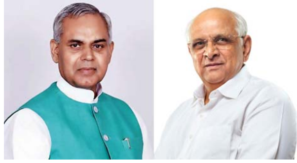
નવસારી, તા.૧૭

ગુજરાતમાં પ્રાકૃતિક ખેતી અંગે જનજાગૃતિ ફેલાવવામાં મહત્વપૂર્ણ યોગદાન આપનાર રાજ્યપાલશ્રી આચાર્ય દેવવ્રત તથા મુખ્યમંત્રીશ્રી ભુપેન્દ્રભાઈ પટેલ તા.૧૮ અને ૧૯ જૂન દરમિયાન બે દિવસીય નવસારી જિલ્લાની મુલાકાતે પધારી રહ્યા છે. તેમના આગમનને લઈ ખેડૂતો