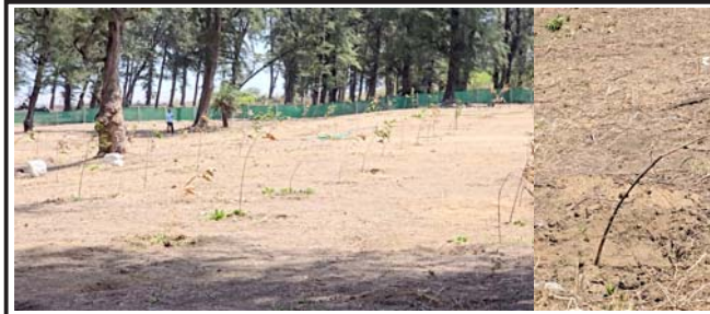
રાજ્યના રાજ્યપાલ શ્રી આચાર્ય દેવ વ્રતજીએ ઉમરગામ દરિયા કિનારે વન વિભાગના અધિકારીઓને નેતાઓની હાજરીમાં કરેલા વૃક્ષારોપણના સુકાયેલા રોપાના ફોટા છે.

આ કાર્યક્રમમાં રાજકીય નેતાઓનું આગમન વિલંબથી થતાં માસૂમ વિદ્યાર્થીઓને કલાકો સુધી કાળજાળ ગરમી અને તડકામાં ઉભા રહેવાની ફરજ પડી હતી. નેતાના આગમન બાદ મંચ પરથી નેતાજી જ્યારે પોતાનું લાંબુ-લચક ભાષણ ઠોકી રહ્યા હતા ત્યારે તડકાને કારણે વિદ્યાર્થીઓની તબિયત એક પછી એક લથડવા લાગી હતી. આશ્ચર્યની વાત એ છે કે, ભાષણ